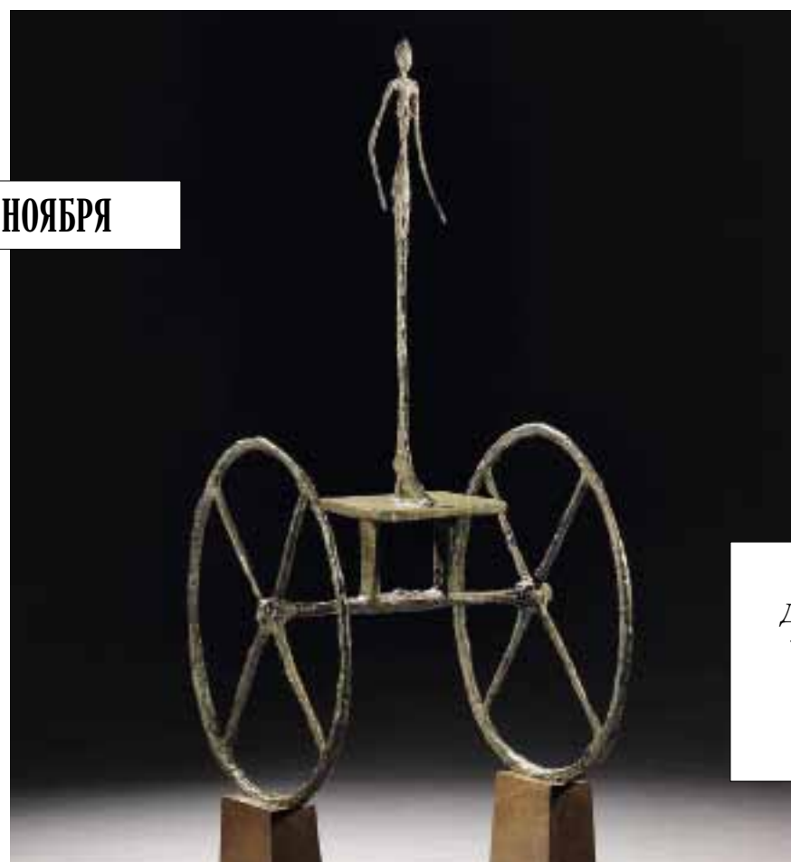
Альберто Джакометти. «Колесница», 1950–1952. Sotheby's, эстимейт $100 млн.

У Sotheby's сосредоточены самые ценные лоты нью-йоркских торгов – уникальная подборка модернистской скульптуры, которую возглавляет «Колесница» Альберто Джакометти. Из шести отливок лишь две хранятся в частных руках, а выставленная на торги к тому же украшена золотой патиной, которая роднит её с изображениями древних богов. Оценка в $100 млн – явная претензия на новый рекорд для скульптора. Также на торгах: высеченная из известняка «Голова» Модильяни ($45 млн) и «Ваза с маргаритками и макаками» Ван Гога, написанная в 1890 году за полтора месяца до смерти ($30–50 млн).