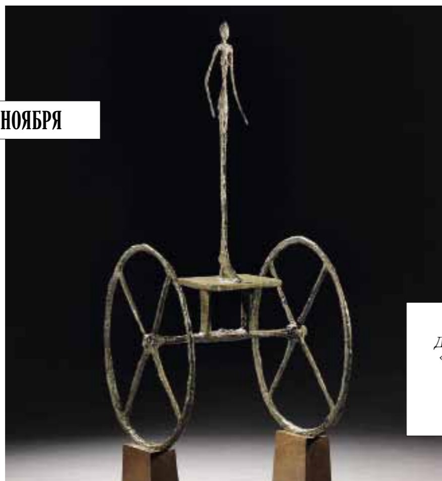
Альберто Джакометти. «Колесница», 1950–1952. Sotheby's, эстимейт $100 млн.

У Sotheby's сосредоточены самые ценные лоты нью-йоркских торгов – уникальная подборка модернистской скульптуры, которую возглавляет «Колесница» Альберто Джакометти. Из шести отливок лишь две хранятся в частных руках, а выставленная на торги к тому же украшена золотой патиной, которая роднит её с изображениями древних богов. Оценка в $100 млн – явная претензия на новый рекорд для скульптора. Также на торгах: высеченная из известняка «Голова» Модильяни ($45 млн) и «Ваза с маргаритками и макаками» Ван Гога, написанная в 1890 году за полтора месяца до смерти ($30–50 млн).