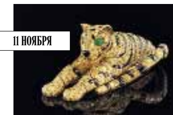
Cartier. Брошь с онксами, бриллиантами и изумрудами, 1950–е. Christie's, эстимейт сета с браслетом $1,8–2,5 млн.

Топ-лот ювелирных торгов Christie's в Женеве – сет из броши и браслета с тиграми от Cartier, созданный в 1950-е годы и сразу попавший к герцогине Виндзорской – единственной женщине в истории, ради любви которой английский король отрёкся от престола. После смерти герцогини «кошки» попали на аукцион, где их купил Эндрю Ллойд Уэббер в подарок жене Саре Брайтман, которая и выставила их сейчас на торги ($1,8–2,5 млн).