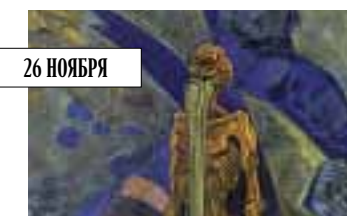
Николай Рерих. «Экстаз», 1918. Bonhams, эстимейт не оглашается.

Главная интрига Bonhams, а, может, и всей русской недели в Лондоне – картина «Экстаз» Николая Рериха 1918 года, изображающая отшельника в горах. Эстимейт не оглашается, но если вспомнить рекорд «Трудов Богоматери» полтора года назад (от £600 тыс. цена поднялась до 7,88 млн), надежды на неё большие. Также у Bonhams – большой Айвазовский (£700–900 тыс.), всегда популярный «китайский» Яковлев и редкий натюрморт модерниста Штгеренберга.