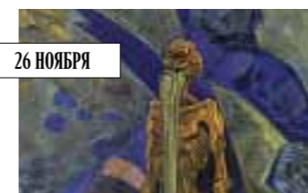
Николай Рерих. «Экстаз», 1918. Bonhams, эстимейт не оглашается.

Главная интрига Bonhams, а, может, и всей русской недели в Лондоне – картина «Экстаз» Николая Рериха 1918 года, изображающая отшельника в горах. Эстимейт не оглашается, но если вспомнить рекорд «Трудов Богоматери» полтора года назад (от £600 тыс. цена поднялась до 7,88 млн), надежды на неё большие. Также у Bonhams – большой Айвазовский (£700–900 тыс.), всегда популярный «китайский» Яковлев и редкий натюрморт модерниста Штгеренберга.