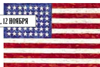
Джаспер Джонс. «Флаг», 1983. Sotheby's, эстимейт $15–20 млн.

Нью-йоркские торги современным искусством содержат несколько хрестоматийных работ, ставших символами XX века. «Флаг» Джаспера Джонса (Sotheby's, $15–20 млн), написанный в технике энкастики, которая использовалась в Византии, превращает в новую икону государственную символику. «Тройной Элвис» и «Четыре Марлона» (Christie's, суммарная оценка – $130 млн) возглавляют поп-пантеон Энди Уорхола.