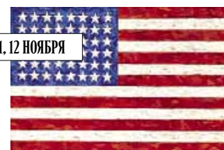
Джаспер Джонс. «Флаг», 1983. Sotheby's, эстимейт $15–20 млн.

Нью-йоркские торги современным искусством содержат несколько хрестоматийных работ, ставших символами XX века. «Флаг» Джаспера Джонса (Sotheby's, $15–20 млн), написанный в технике энкастики, которая использовалась в Византии, превращает в новую икону государственную символику. «Тройной Элвис» и «Четыре Марлона» (Christie's, суммарная оценка – $130 млн) возглавляют поп-пантеон Энди Уорхола.