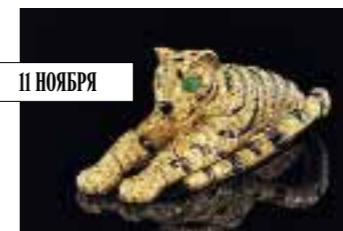
Cartier. Брошь с онксами, бриллиантами и изумрудами, 1950–е. Christie's, эстимейт сета с браслетом $1,8–2,5 млн.

Топ-лот ювелирных торгов Christie's в Женеве – сет из броши и браслета с тиграми от Cartier, созданный в 1950-е годы и сразу попавший к герцогине Виндзорской – единственной женщине в истории, ради любви которой английский король отрёкся от престола. После смерти герцогини «кошки» попали на аукцион, где их купил Эндрю Ллойд Уэббер в подарок жене Саре Брайтман, которая и выставила их сейчас на торги ($1,8–2,5 млн).