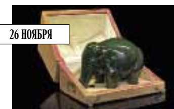
Фирма К. Фаберже. Резная фигурка слона из нефрита в оригинальной коробке, около 1900. MacDougall's, эстимейт £250–300 тыс.

MacDougall's – единственный из участников русской недели – устраивает предаукционную выставку в Москве (5–6 ноября). Топ-лот среди прикладных предметов на лондонских торгах – резной нефритовый слон (высотой 20 см) с глазами-алмазами. В фигурке читаются восточные черты – Николай II часто делал подарки фирмы Фаберже сямскому королю Рама V. Также на торгах – живопись Григорьева, Репина, Комара и Меламида.