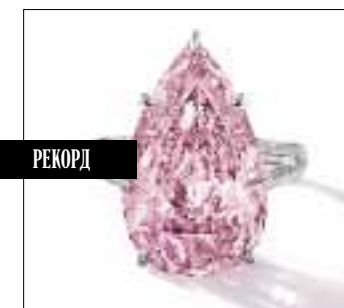
Кольцо с ярко-розовым бриллиантом. Sotheby's, продано 7 октября 2014 года за $17,77 млн.

Новый рекордсмен среди розовых бриллиантов весом 8,41 карата безупречен по чистоте (категория Internally Flawless по шкале GIA Геомологического института Америки) и имеет лёгкий фиолетовый оттенок. Самый редкие в природе розовые алмазы появляются вследствие деформации кристаллической решётки. Изначально камень был круглым и весил 18 карат, но ювелиры De Beers придали ему изящную грушевидную форму.