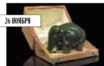
Фирма К. Фаберже. Резная фигурка слона из нефрита в оригинальной коробке, около 1900. MacDougall's, эстимейт £250–300 тыс.

MacDougall's – единственный из участников русской недели – устраивает предаукционную выставку в Москве (5–6 ноября). Топ-лот среди прикладных предметов на лондонских торгах – резной нефритовый слон (высотой 20 см) с глазами-алмазами. В фигурке читаются восточные черты – Николай II часто делал подарки фирмы Фаберже сямскому королю Рама V. Также на торгах – живопись Григорьева, Репина, Комара и Меламида.